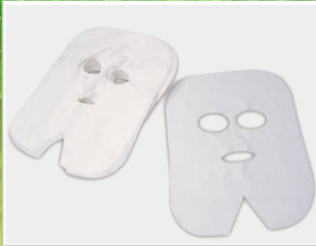
BIO 320 Gesichtsmaske