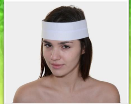
BIO 322 Haarband