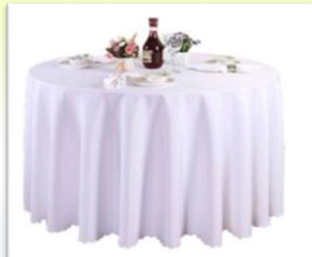
BIO 321 Reihe von weißen maßgeschneiderten Tischdecken