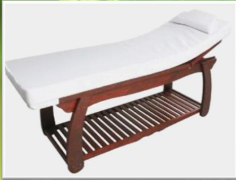
BIO 111 Strandtuch 100x200