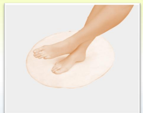
BIO 112 Runde Matte